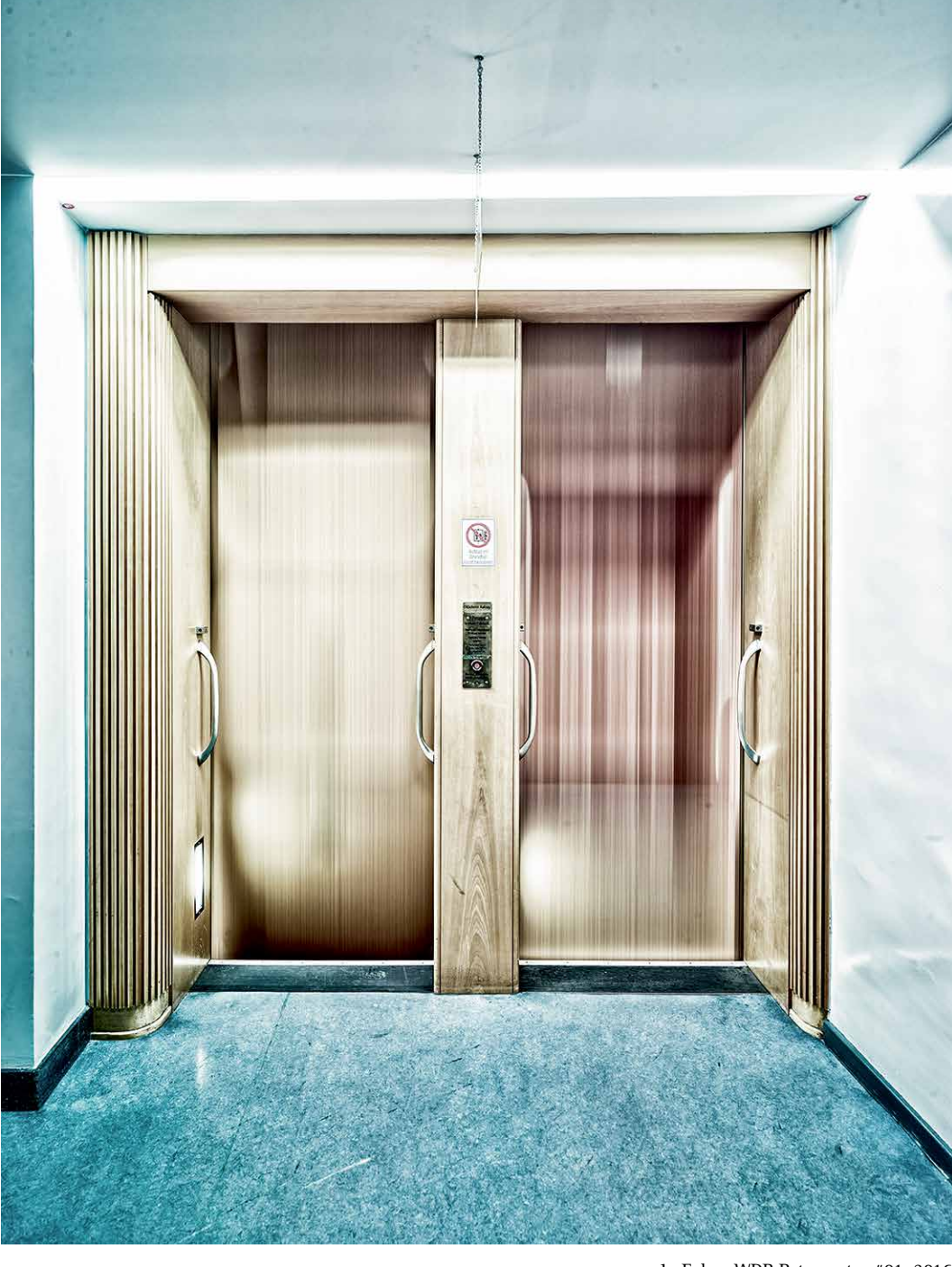
Jo Fober, WDR Paternoster #01, 2016