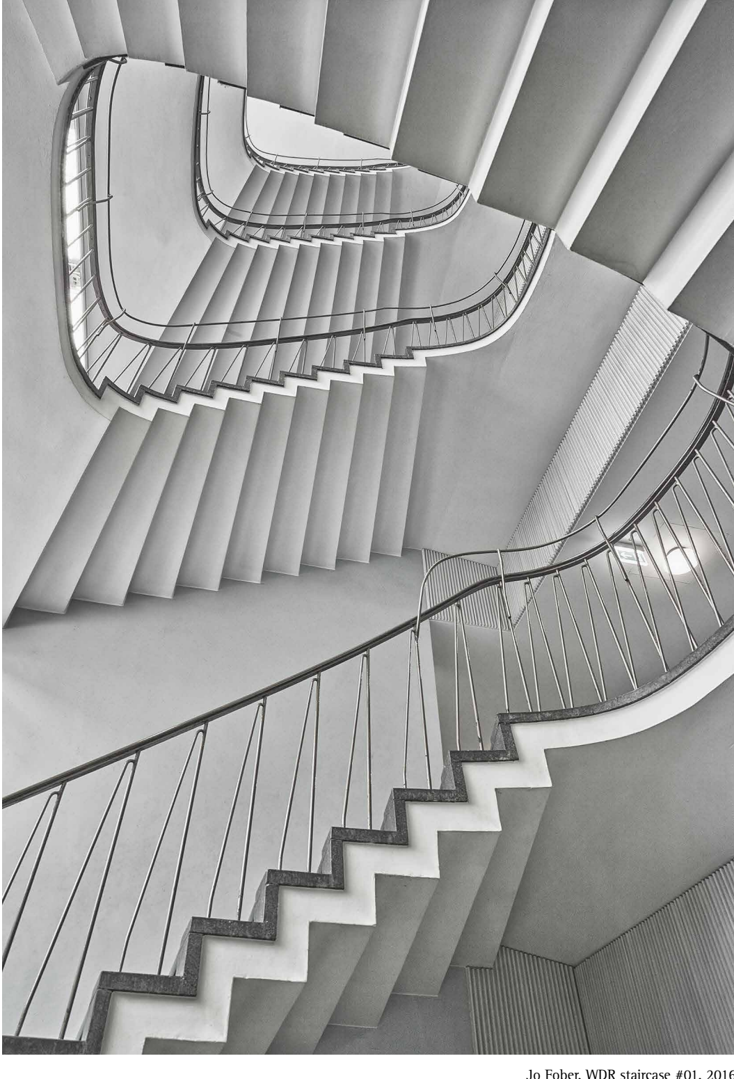
Jo Fober, WDR staircase #01, 2016

Öffnungszeiten: Di. + Mi. 10:00-15:00 // Do. + Fr. 10:00 - 18:00 // Sa. 12:00-17:00